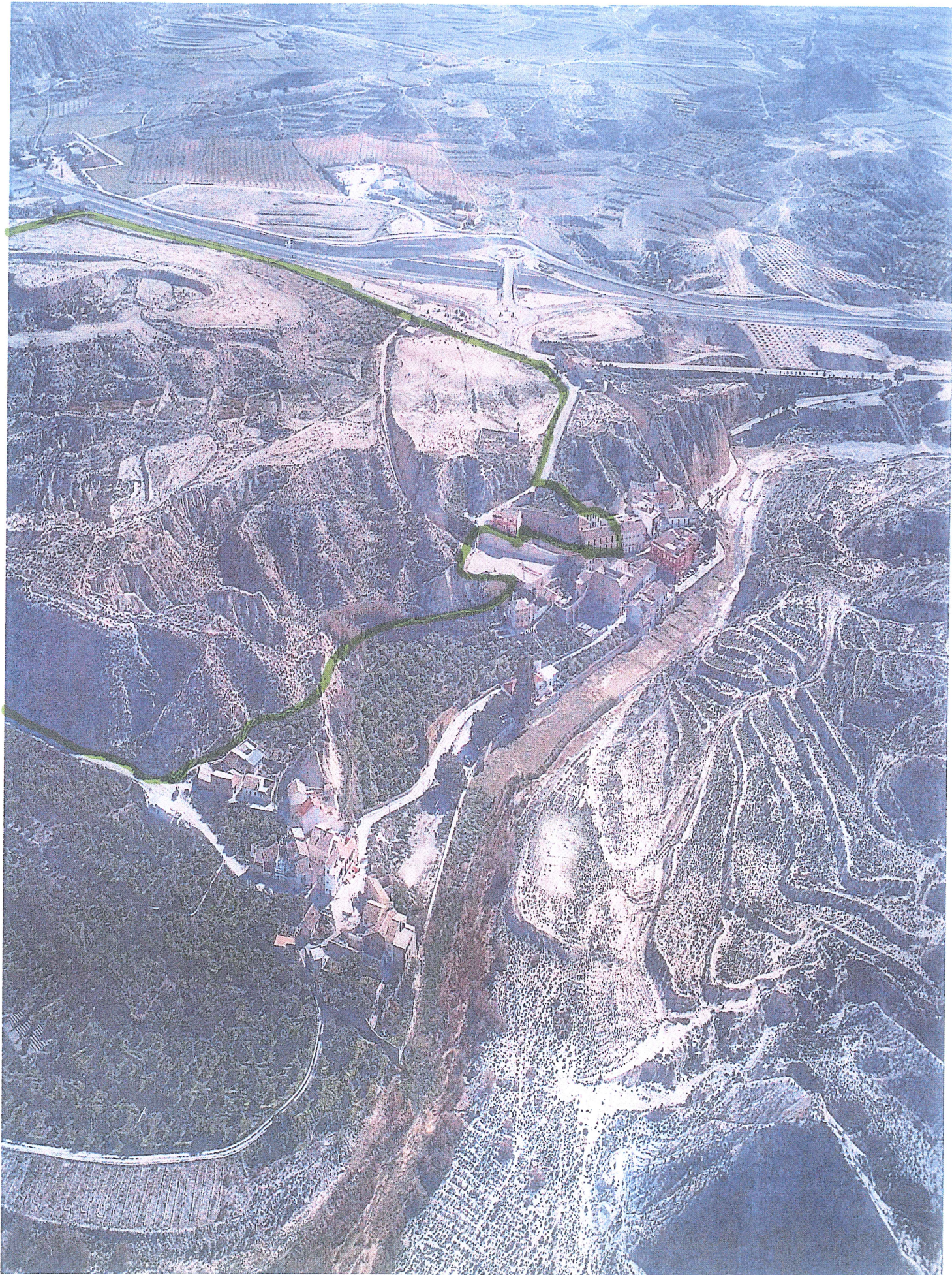
NUEVOS BAÑOS DE MULA, S.L. (PERIMETRO PROPIEDAD)