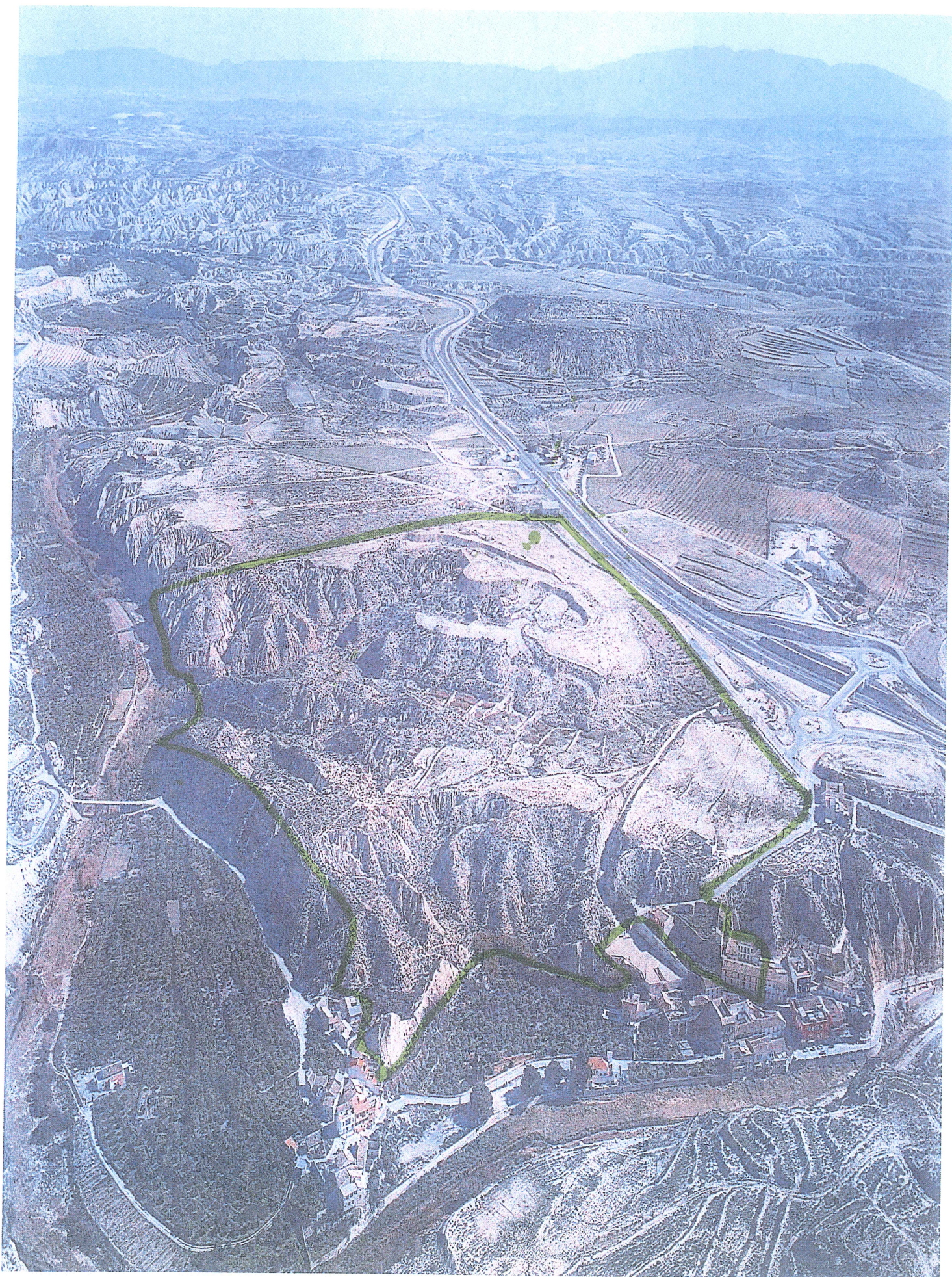
NUEVOS BAÑOS DE MULA, S.L. (PERIMETRO PROPIEDAD)