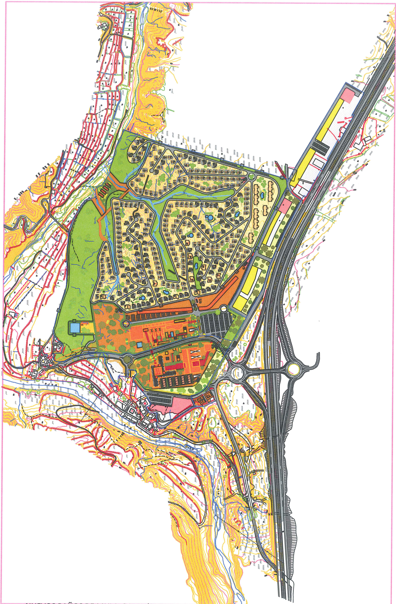
NUEVOS BAÑOS DE MULA, S.L. (SITUACION Y CONJUNTO)